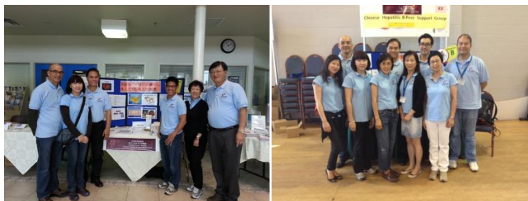
小組核心成員攝於加拿大肝臟基金會及華人健康關注日研討會